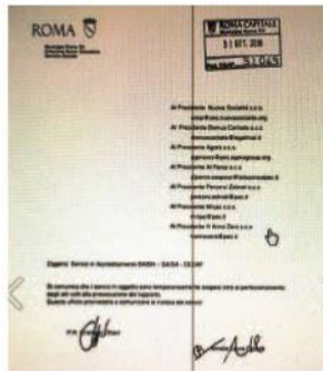
La nota del XII municipio che blocca i servizi