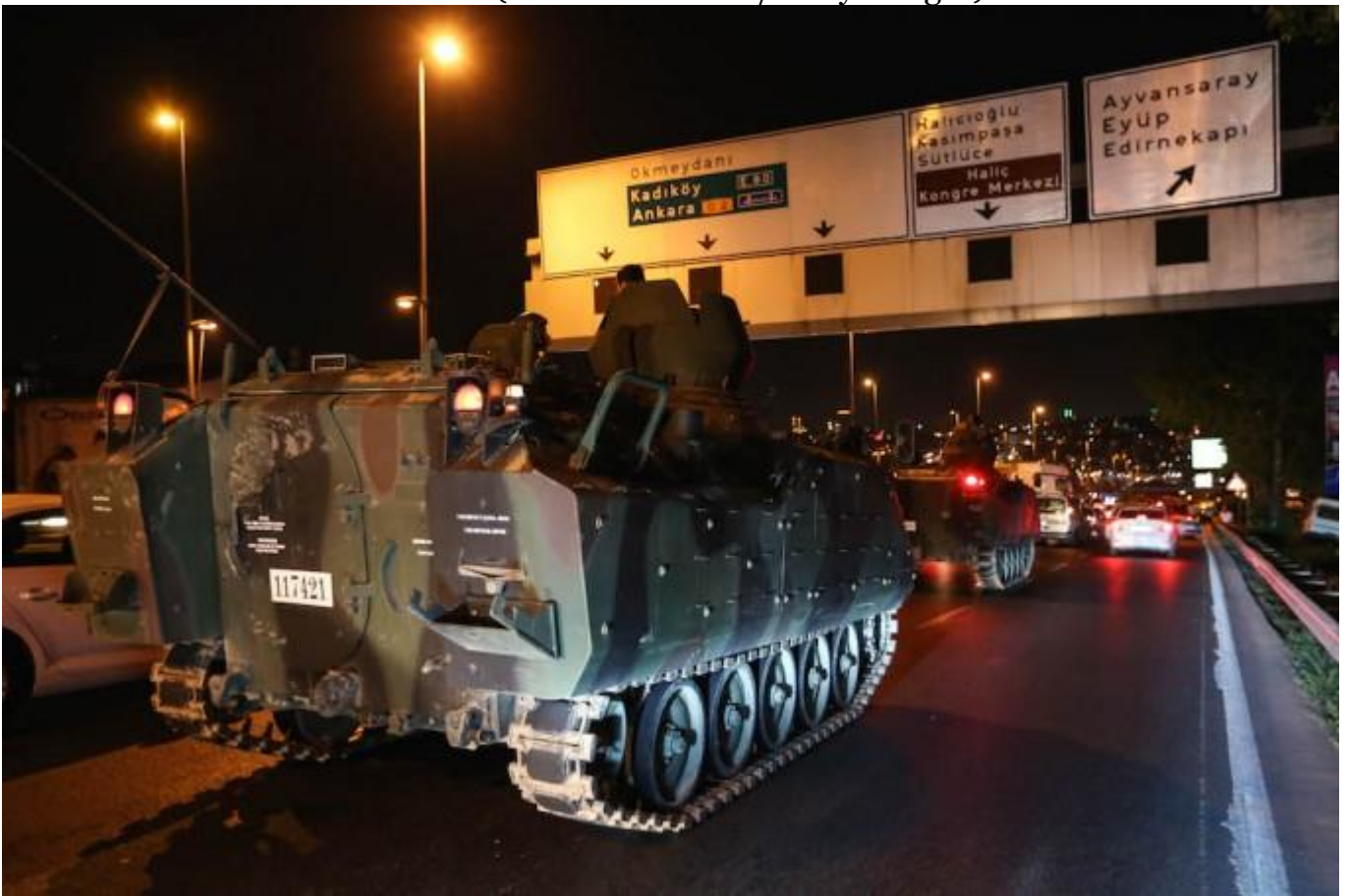
Carri armati in strada a Istanbul